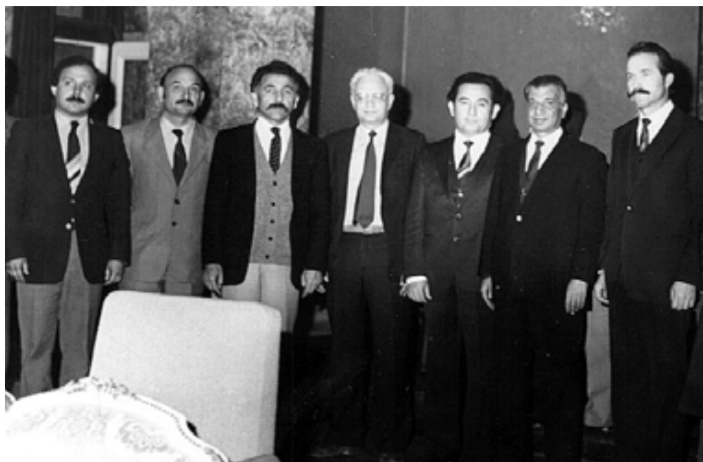
Фотография на память после одного из совещаний. Второй справа-президент республики Афганистан Бабрак Кармаль, второй слева - Геннадий Устюжанин.

Я знал, что религия Ислам прочно вошла в уклад и образ жизни афганцев. Для Востока это характерно. Но в сочетании с полнейшей безграмотностью людей она сделала многих мусульман настоящими фанатиками. В Афганистане действовало в то время 23 тысячи мечетей, 14 тысяч святых мест, насчитывалось свыше 250 тысяч мулл и других служителей культа. На каждые 60 человек – священнослужитель. Такой высокой насыщенности духовенства не существует больше ни в одной стране мира. Ничто не делается в Афганистане без благословения священнослужителей. Силу влияния слова муллы россиянину даже не представить. Повелит