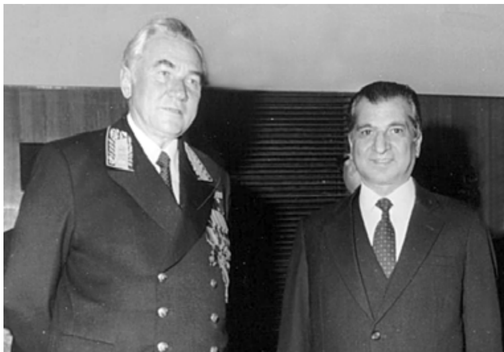
Посол СССР в республики Афганистан Фикрят Ахметжанович Табеев и президент демократической республики Афганистан Бабрак Кармаль.

Задачи аппарата советников ЦК КПСС при Центральном Комитете Народно-демократической партии Афганистана были весьма обширными. Они не ограничивались вопросами только партийного строительства и партийной жизни, а охва-