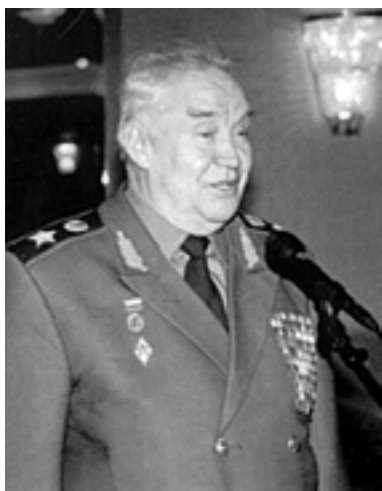
Гареев Махмут Ахметович