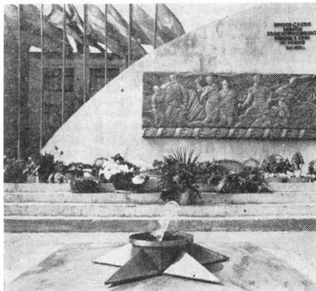
В честь полиграфмашевцев, павших в боях за Родину, у завода горит Вечный огонь.