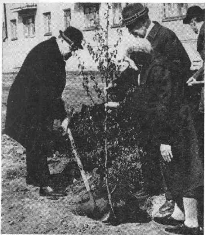
Закладка аллей ветеранов.