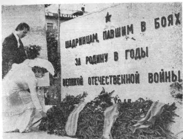
В Шадринске есть добрая традиция: молодожены возлагают цветы к обелиску погибшим воинам.

ского фронта участвовал в историческом параде Победы на Красной площади в Москве 24 июня 1945 года.