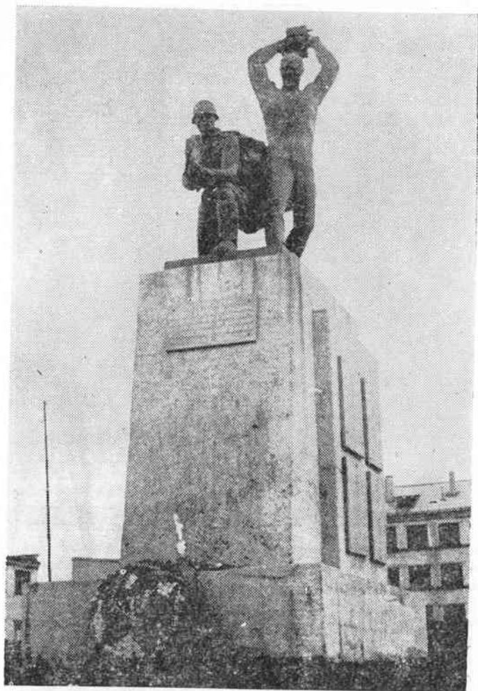
Памятник землякам, погибшим в Великой Отечественной войне, в совхозе «Красная Звезда».