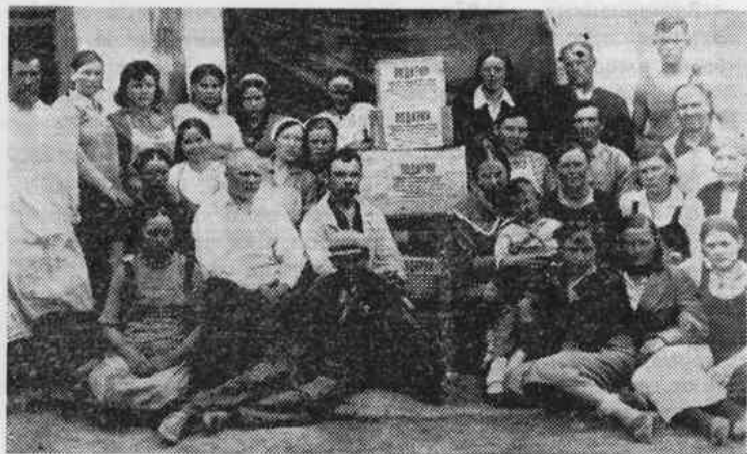
Подарки фронту. Фото 1942 года.

Не остались в стороне петуховцы и в таком важном деле, как сбор подарков фронтовикам. Колхозники сельхозартели имени Сталина с большой любовью готовили их к 24-й годовщине Красной Армии. На склад районной комиссии от них поступило более 300 подарков: кисеты с