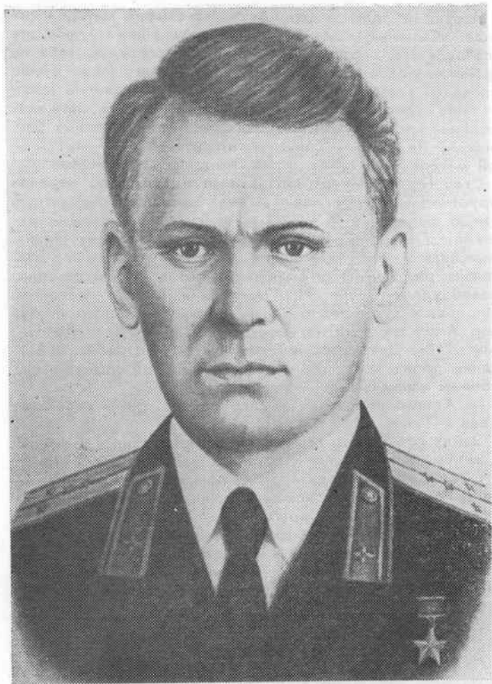
Герой Советского Союза Петр Григорьевич Агеев.