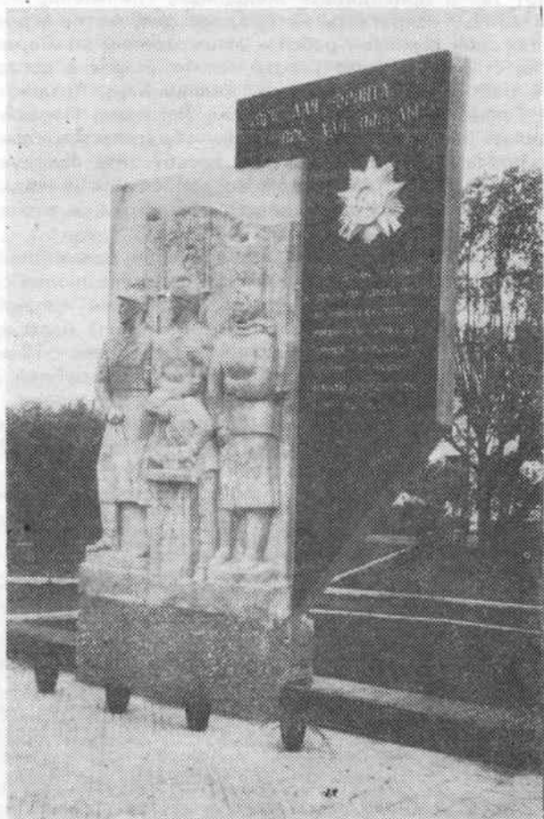
Памятник труженикам тыла на Шумихинском машиностроительном заводе.