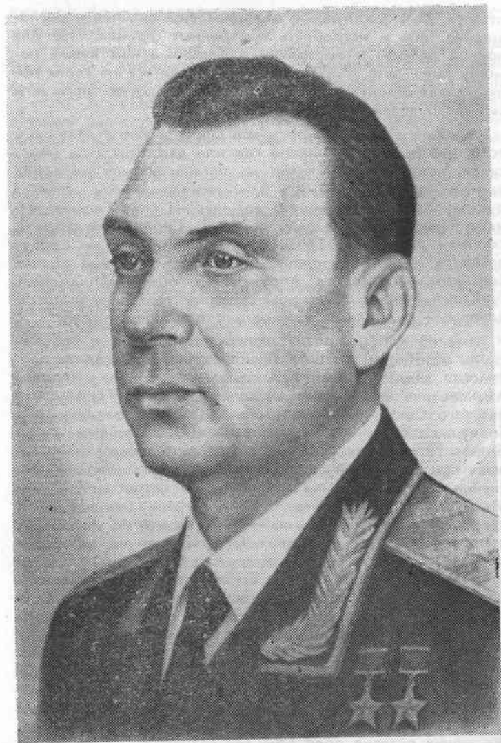
Дважды Герой Советского Союза Кирилл Алексеевич Евстигнеев.