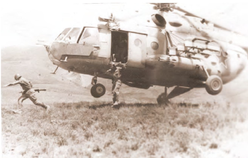
Высадка десанта, Афганистан