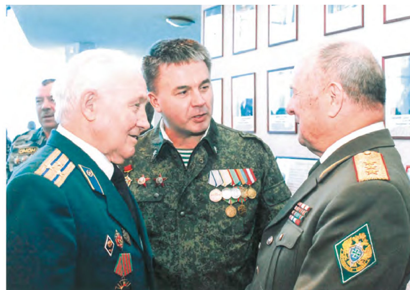
25 лет вывода войск из Афганистана (М. Валеев, Н. Зензин, Е. Макаров) Февраль 2014 года