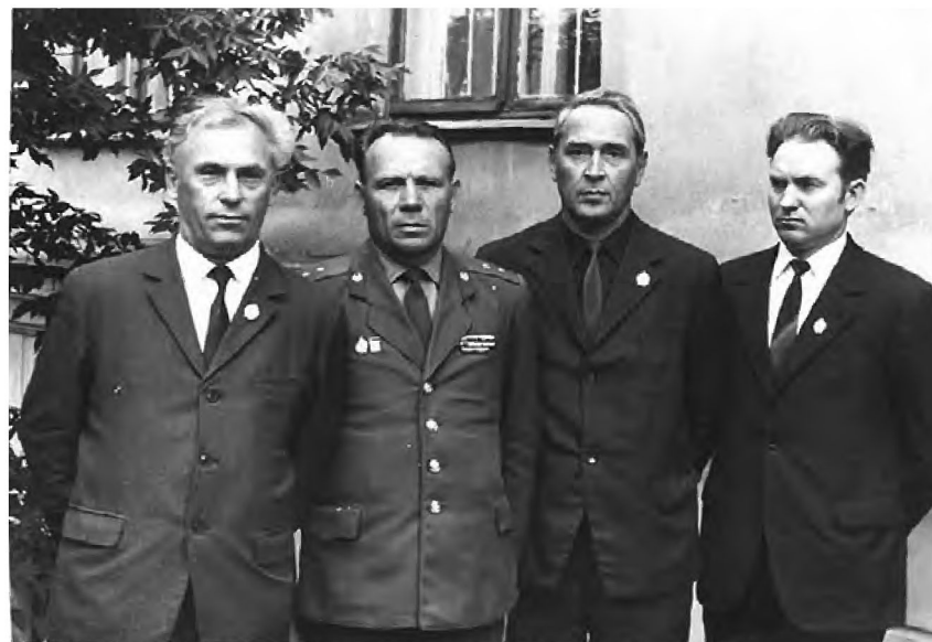
Лауреаты юбилейного знака ЦС «Динамо» 1973 год