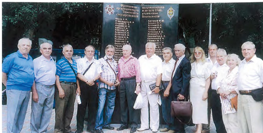
Тюменские чекисты на открытии памятного знака чекистам-фронтовикам Август 2014 года