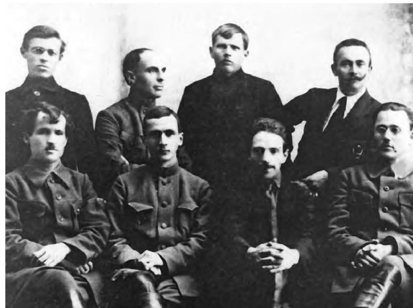
Члены Тюменской коллегии губчека 1921 год