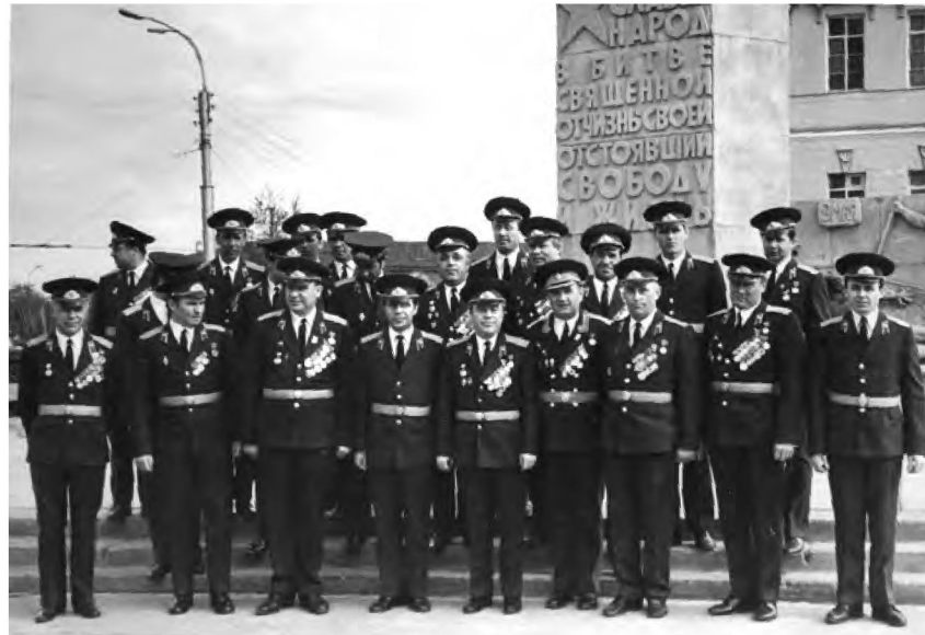
Генерал Третьяков М. И. и его команда 9 мая 1975 года