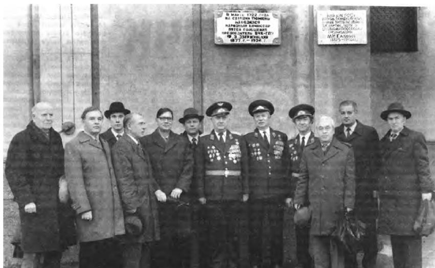
Тюменские чекисты у памятной доски Ф. Э. Дзержинскому 1968 год, ж/д вокзал