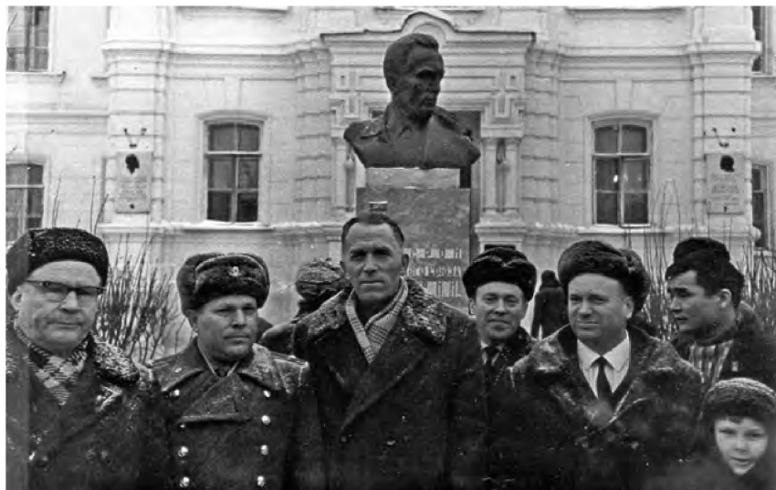
Открытие памятника Н. И. Кузнецову 19 декабря 1967 года