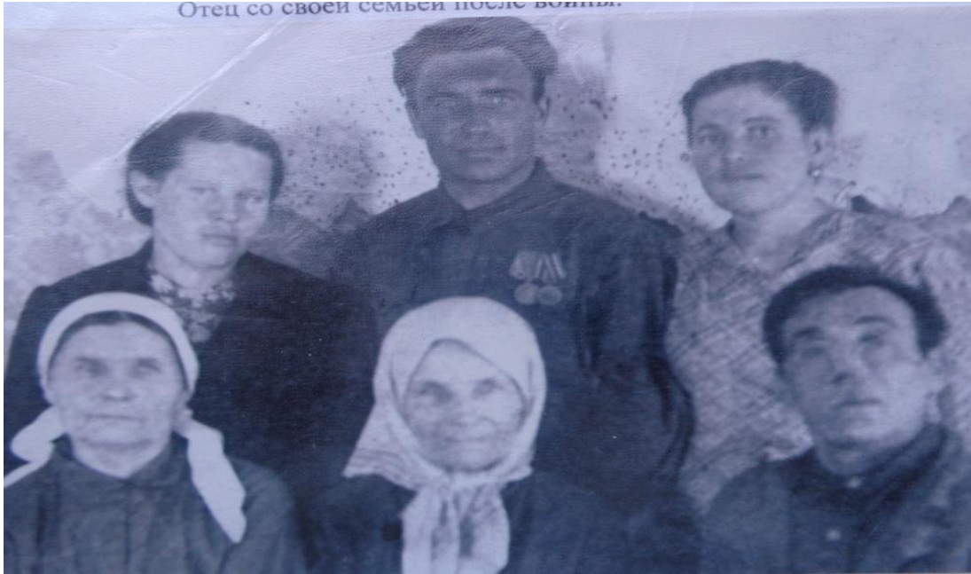
Отец со своей семьей после войны.