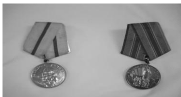
Рис 2. «За оборону г.Киева получена в июне 1962 г. В честь присвоения г. Киеву звание «город – герой». 21 июня 1961г. – медаль «20-е начала ВОВ.