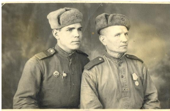
рис.5. фото с фронта