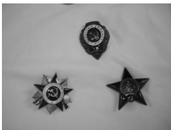
рис.3 1. Награда орден Красной звезды, награжден в 1944г. 2. Отличник связист. 3. Пролетарии всех стран объединяйтесь