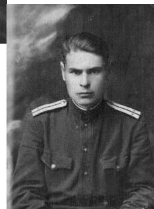
Участник Великой Отечественной войны