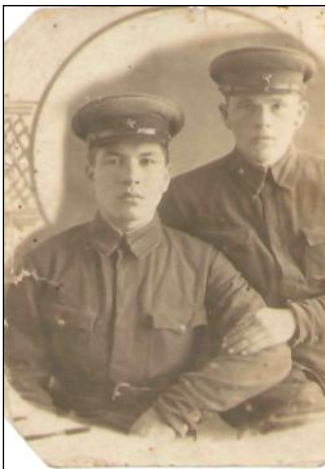
Фото военной поры