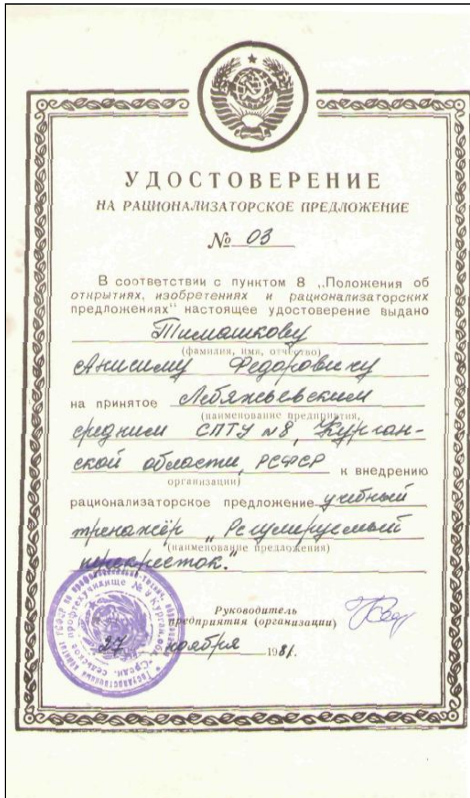
Удостоверение на рационализаторское предложение