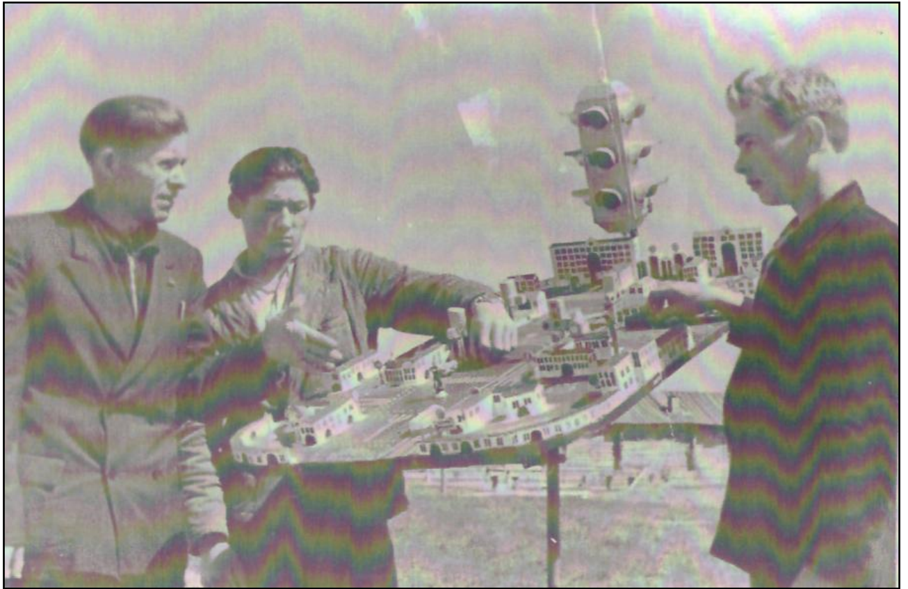
Стол разводки со светофорами (1963 г.)