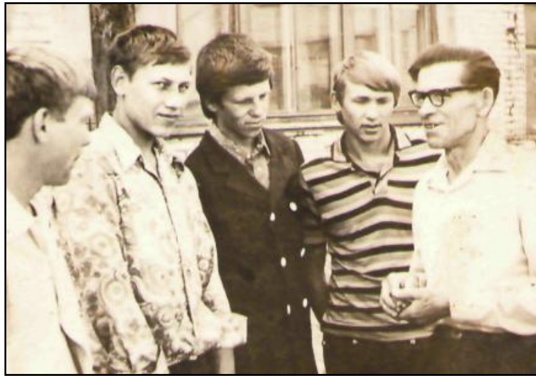
Среди своих учеников