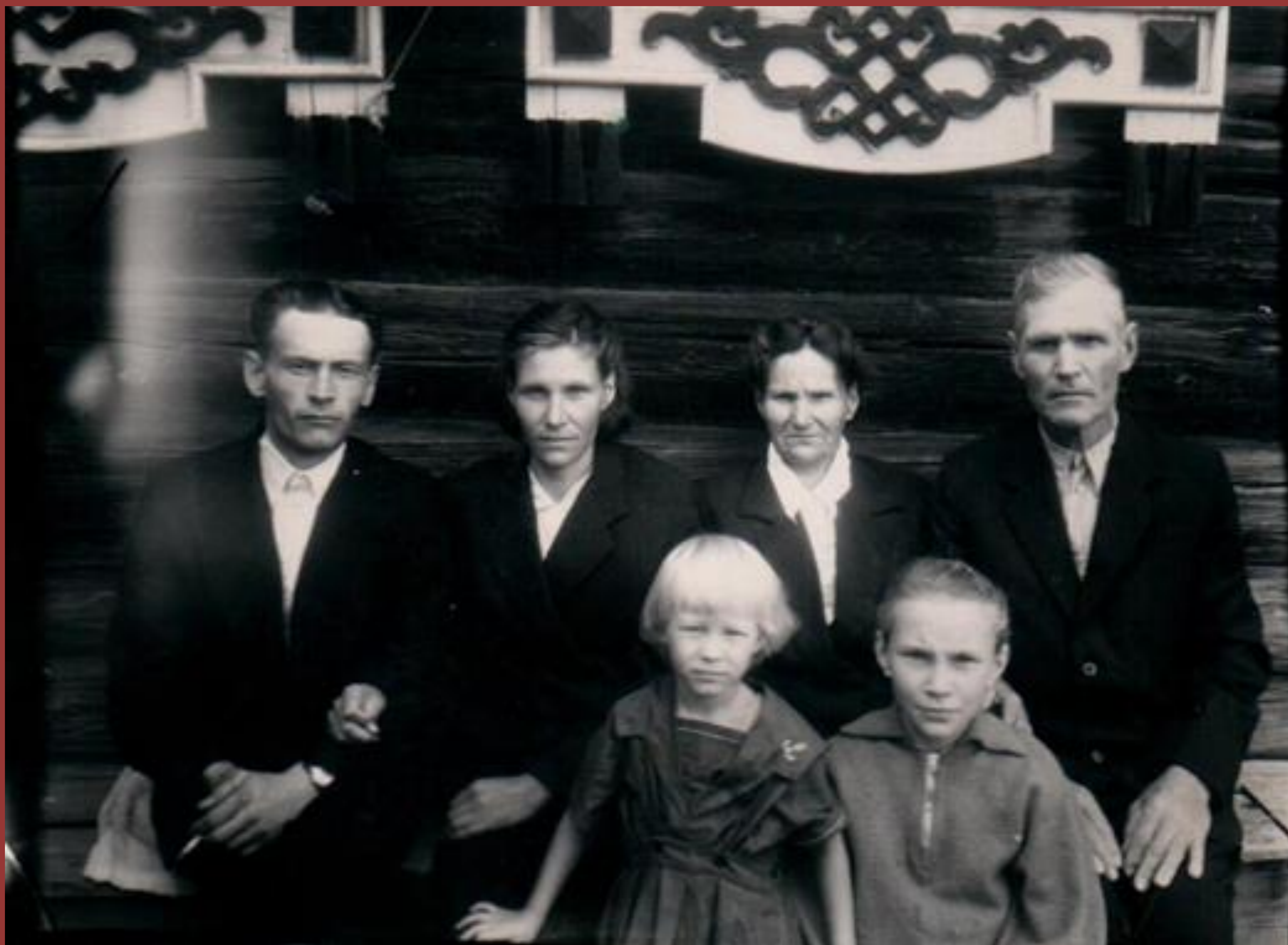
Ангелина Яковлевна с родителями, мужем и детьми