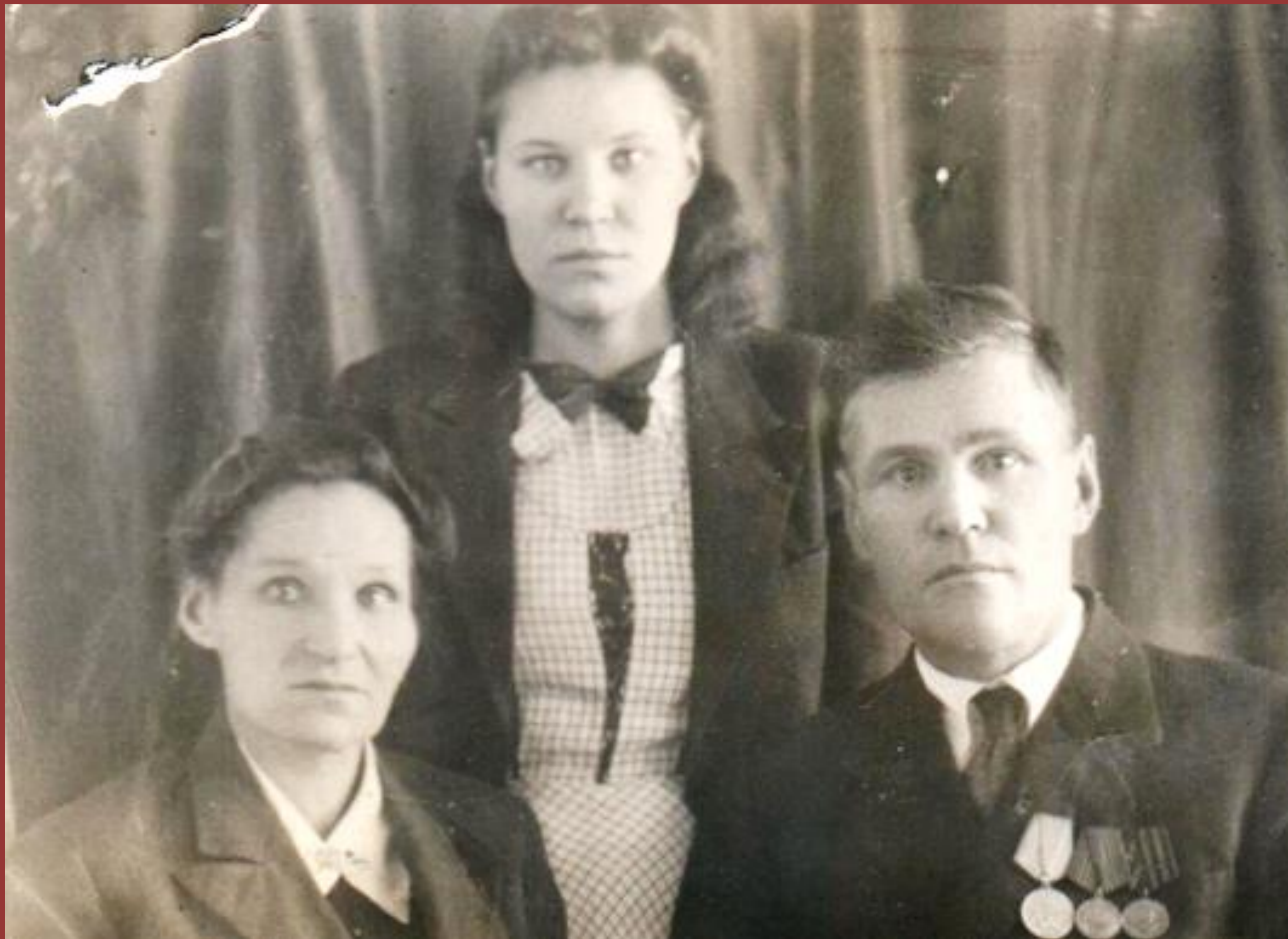
Фото с родителями